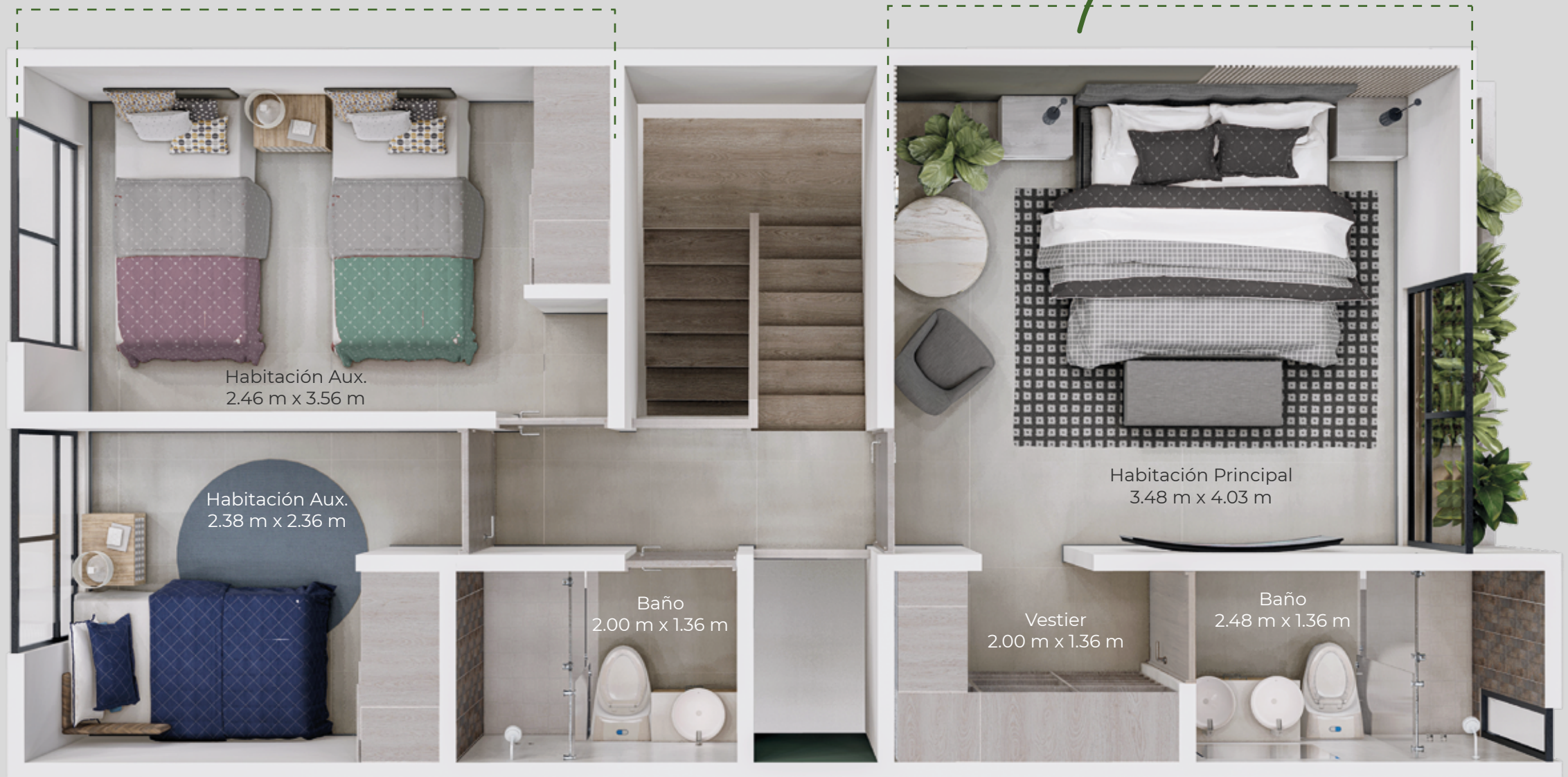
Habitación Aux. 2.46 m x 3.56 m